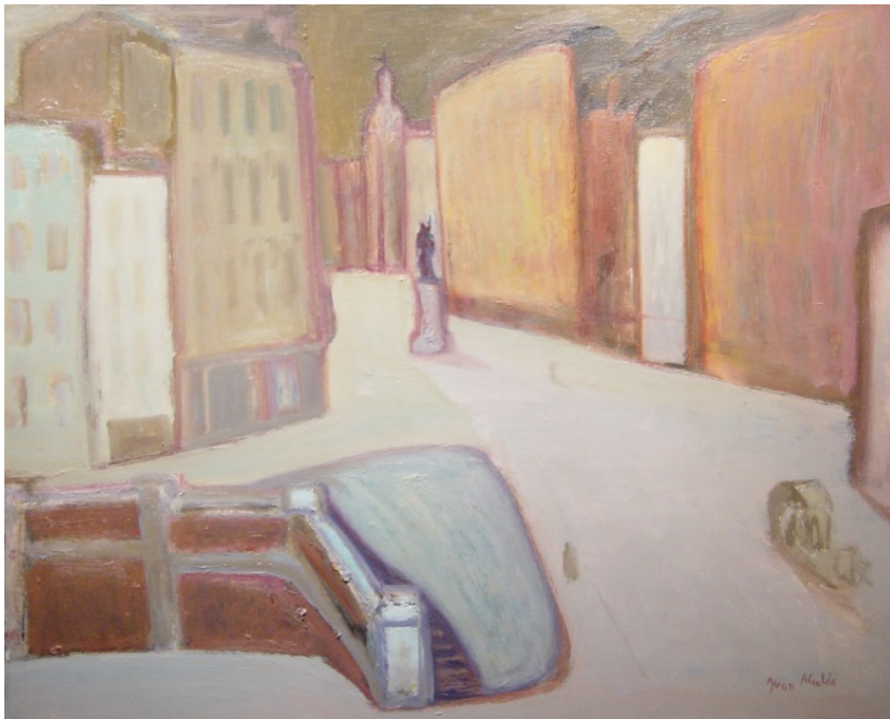
12. El Rastro, Madrid. (c.1982). 81 x 100 cm. Oli/tela.