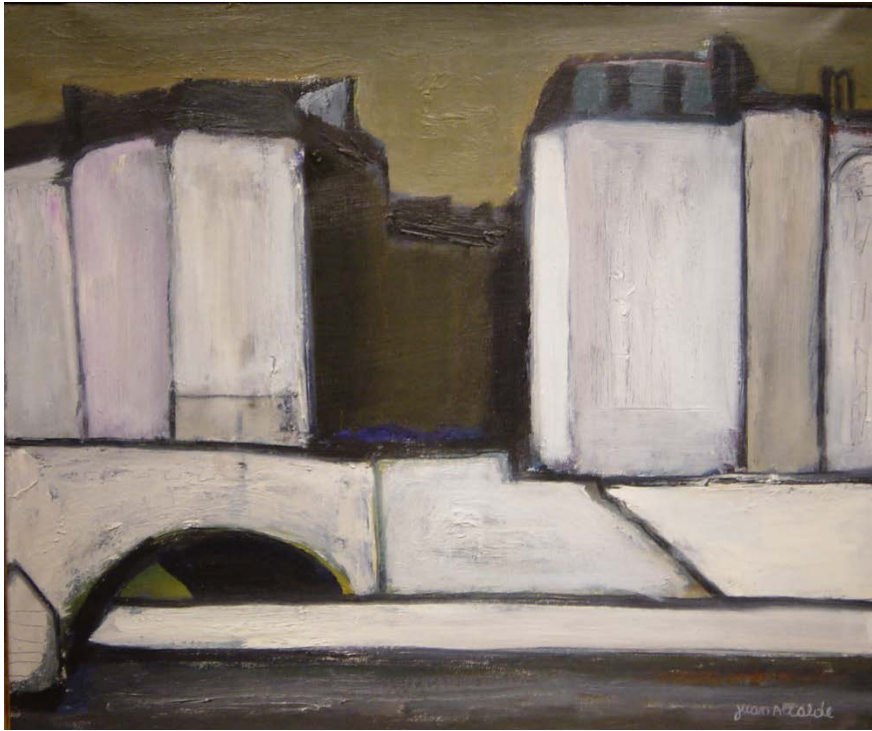
14. Pont Louis Philippe. Paris (c.1983). Paris. 54 x 65 cm. oli/tela