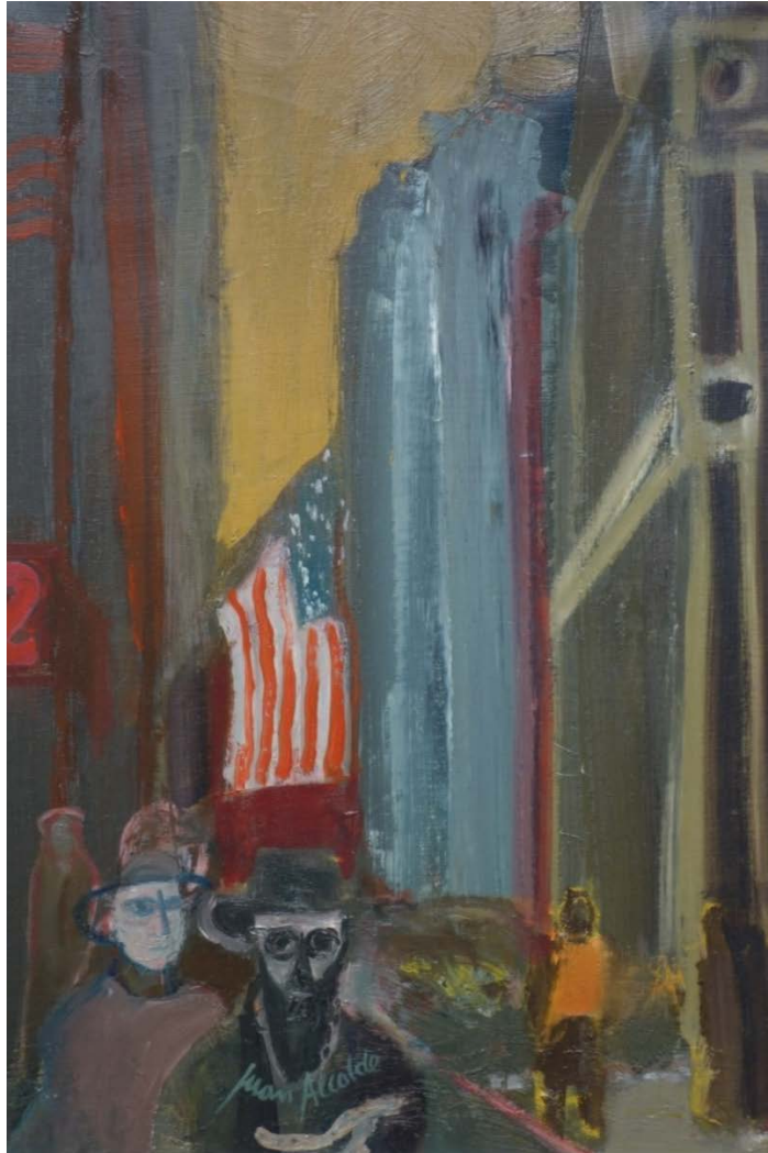
8. 7th Avenue NY. (1978). 53 x 35 cm. Oli/tela