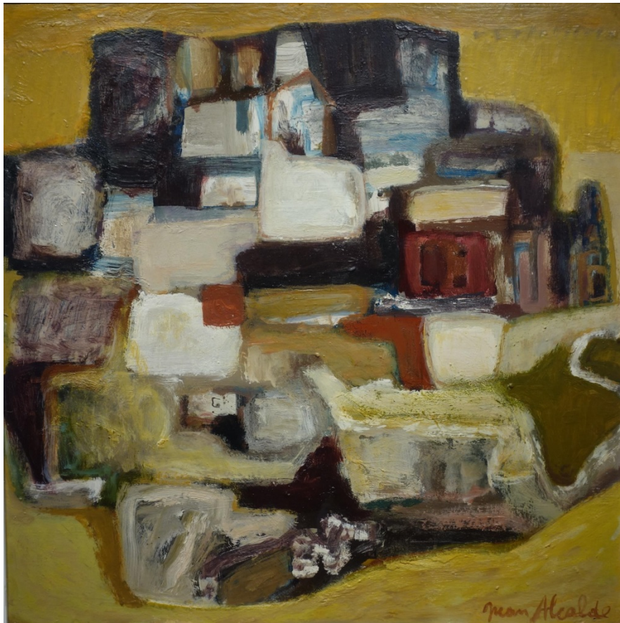
1. La meseta. (c.1970). 64 x 64 cm. Oli/fusta