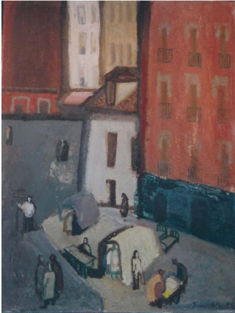
5. El Hospital (c.1974). 130 x 97 cm. Oli/tela.