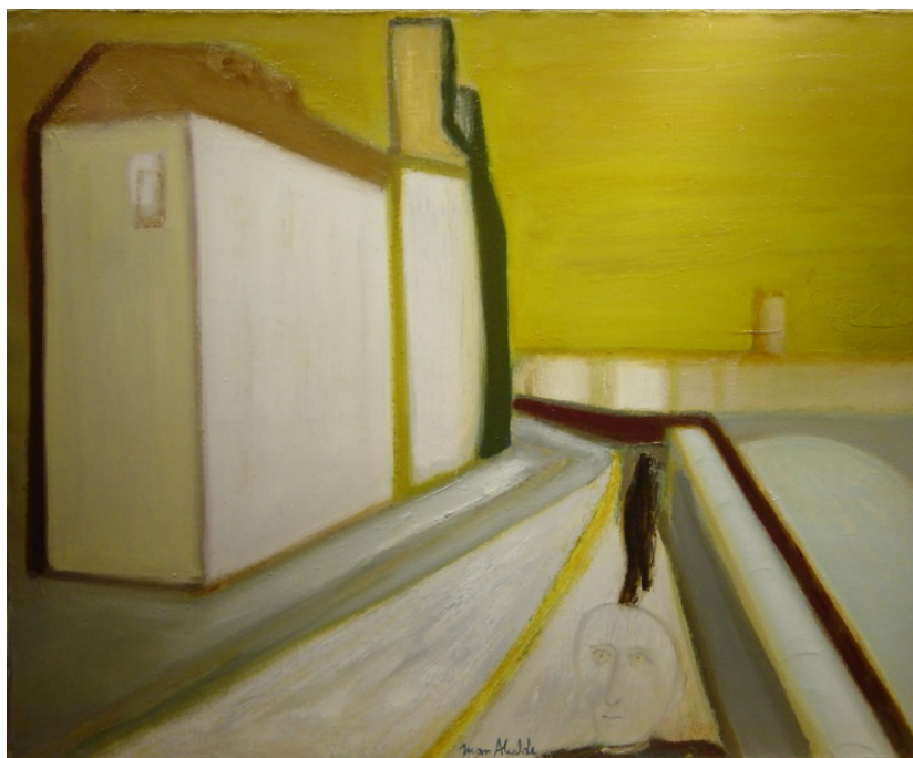
13. París cielo amarillo. (1975). 81 x 100 cm. Oli/ tela.